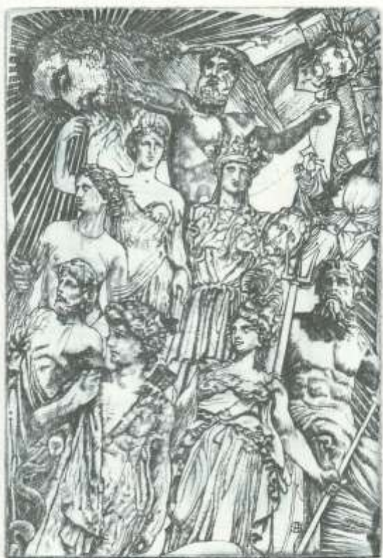
Grafika Pavla Hlavatého ke sbírce A. Nevečeřala Tichý poutník.

(Aleš Nevečeřal, básně ze sbírky Tichý poutník)