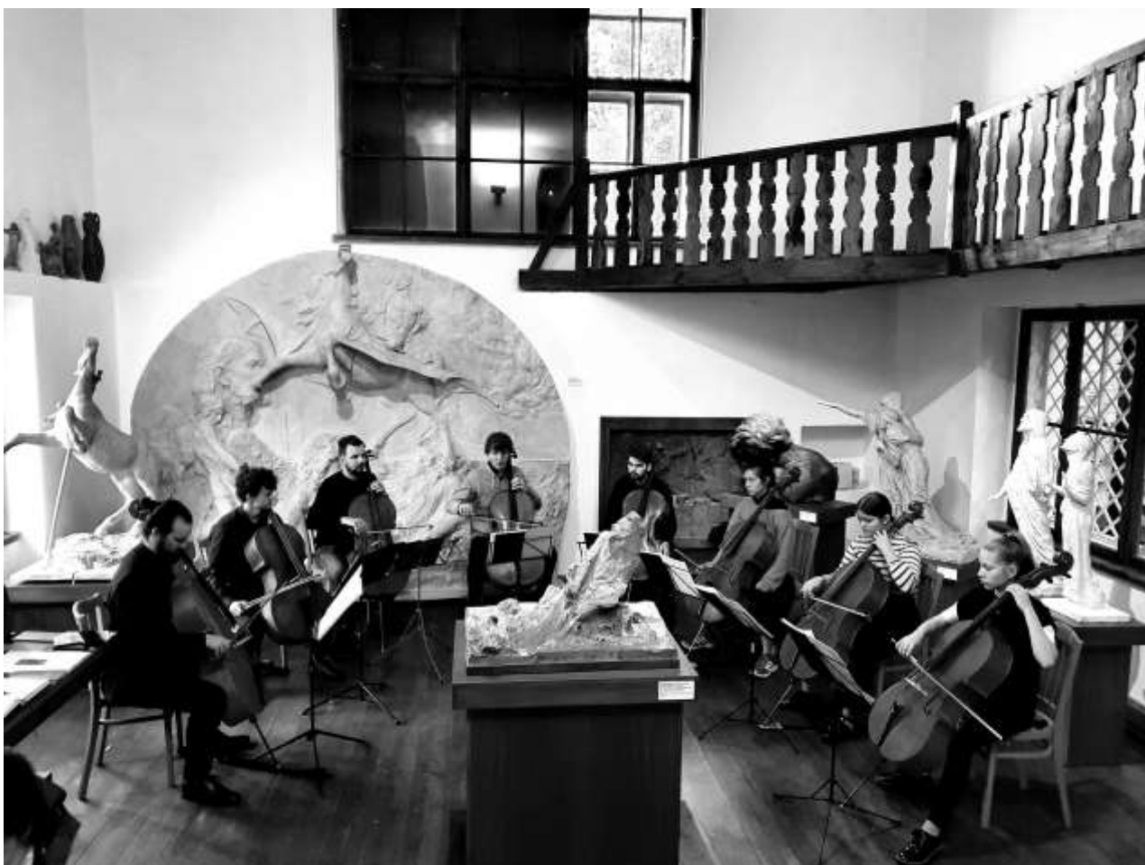
Festivalový koncert Cello ansámblu sv. Cecilie v Bílkově ateliéru v Chýnově dne 29. 8. 2021.