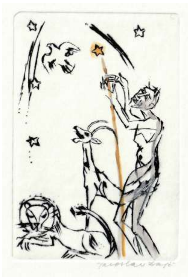
Grafika Jaroslava Dajče k P. F. 2018 A. Nevečeřala.